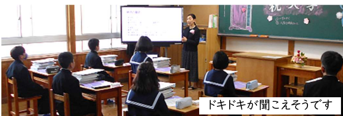
ドキドキが聞こえそうです