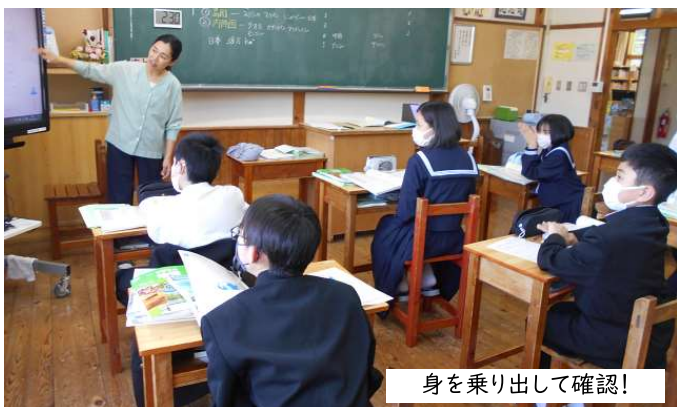
身を乗り出して確認!

「1年生の手本になるように頑張りたい」という気持ちが伝わってくるリハーサルでした。