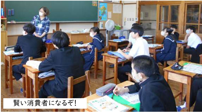
賢い消費者になるぞ!

3年生は、家庭科の授業中。商品の購入で被害にあわないように、悪徳商法の特徴とその予防や対処方法について、動画を見ながら学習していました。