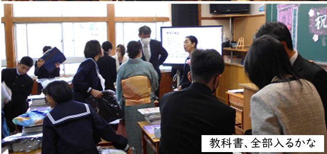
教科書、全部入るかな

初めは、ちょっぴり緊張した様子。真新しい教科書に自分で名前を書き、カバンに全部詰め込んで持ってみる。その重さに、ご家族も驚かされていました。